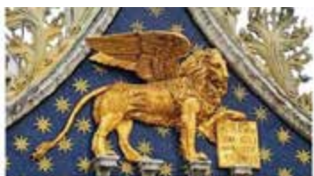
ASSOCIAZIONE DEI VENETI A ROMA

Dal 1981, l' Associazione Veneti a Roma è un punto di riferimento per i Veneti che vivono nella Capitale, mantenendo vive le tradizioni e il legame con la loro terra d'origine. Attraver-